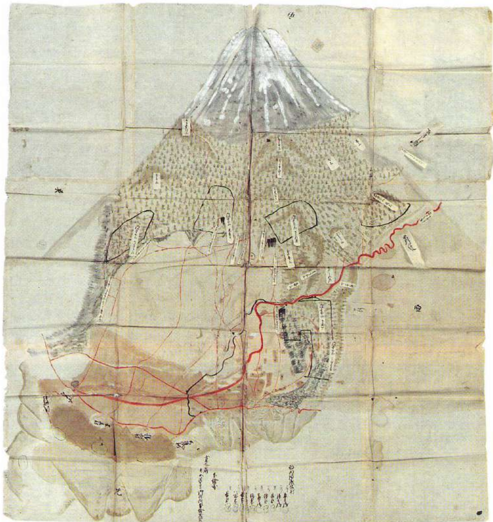
御巢鷹山絵図（寛延4年）