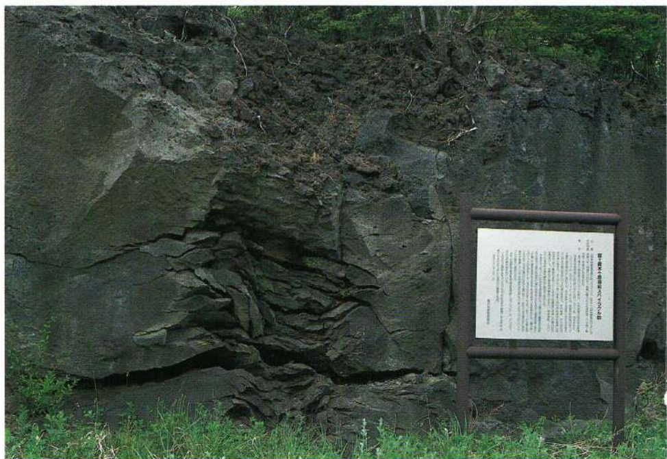
富士山溶岩スパイラル