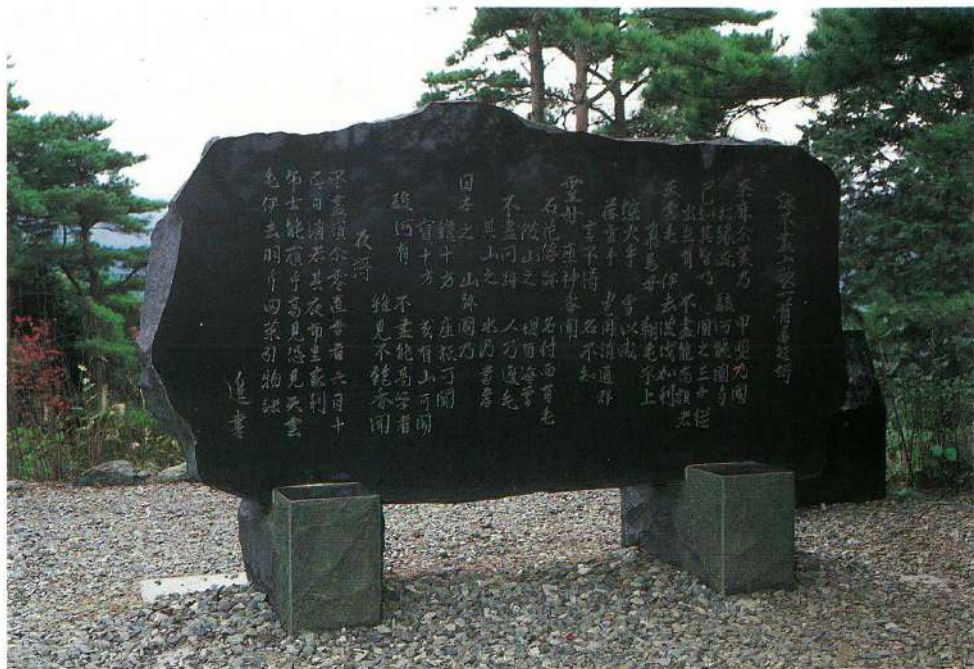
万葉の歌碑（足和田山・紅葉台）