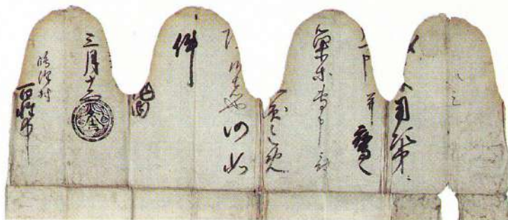
「材木・御巢鷹御用」加藤光吉文書（文禄2年・部分）