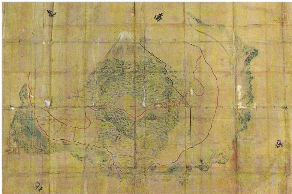
甲駿国境論争裁許絵図（元禄15年）