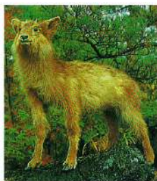
村の獣・カモシカ