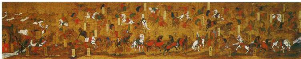
宮沢氷堂筆の千匹馬(通玄寺蔵)