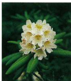
村の花・シャクナゲ