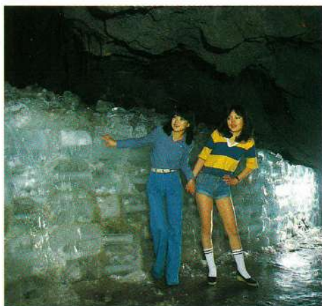
観光客に人気の鳴沢氷穴