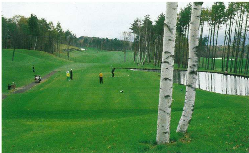
富士山ろくに広がるゴルフ場