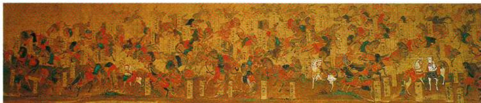
宮沢氷堂筆の千匹馬(通玄寺蔵)