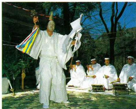
太々神楽の一部「五行の舞」