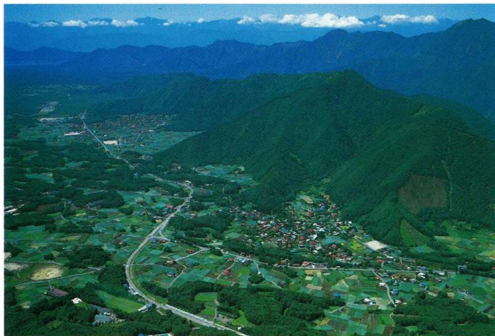
山ふところの大田和