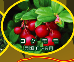
コケモモ 見頃 6~9月