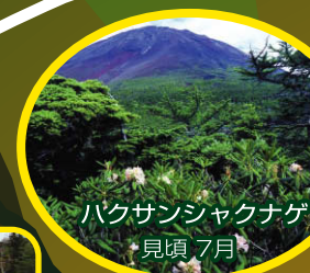
ハクサンシャクナゲ 見頃 7月