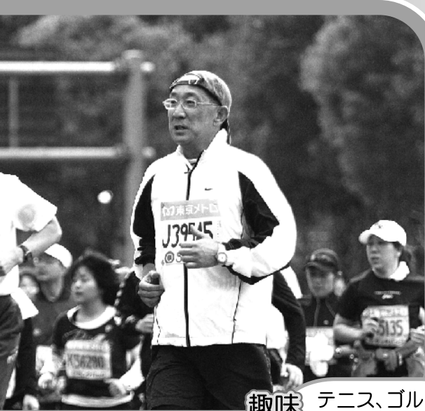
趣味 テニス、ゴルフ、 マラソン、読書