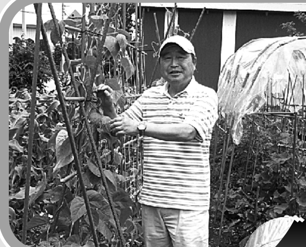
趣味 ラグビー観戦、ウォーキング