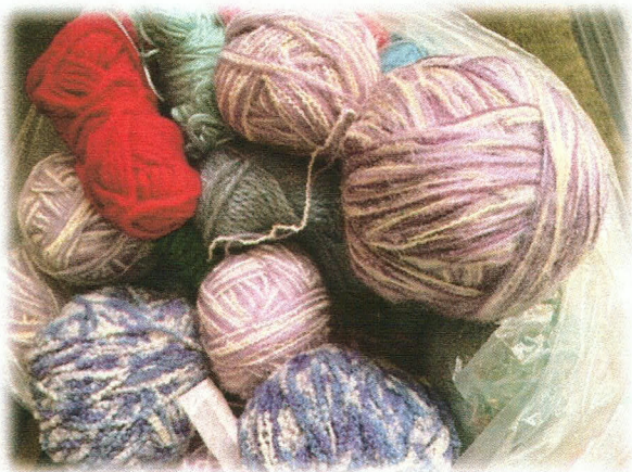
▲寄付していただいた毛糸