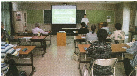
▲認知症サポーター養成講座