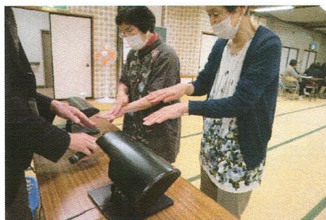
▲食品衛生研修：手洗いチェッカー