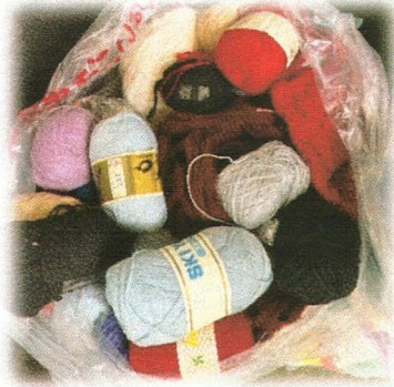
▲寄付していただいた毛糸