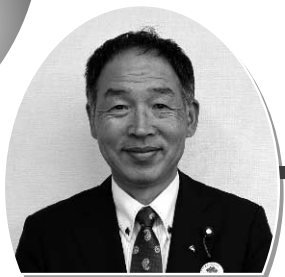
小林 昭一 議員