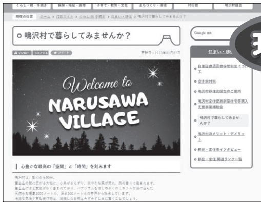
移住・定住ページ

村内に定住するための住宅を取得する若者世帯に対して補助金を創設。 村のホームページに移住・定住ページを設け情報を積極的に情報発信し子育てしやすい村を紹介して「子育て世代」を中心とした移住者の獲得を目指す。