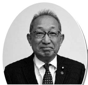
土屋 文明 議員