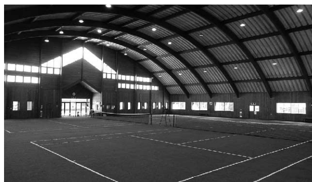
屋内テニスコート場

ただし、事業費としてはかなりの金額となる。今後は、事業実施に係る助成金等の財源等を含めて具体的に検討を進めたい。