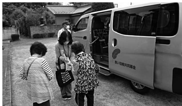
松伏町社協の買い物移動支援サービス (埼玉県北葛飾郡)

さんが生き生きと健康的に暮らすための生活支援や交通施策を検討していく必要があると考え、新たな送迎サービスなど役場と社会福祉協議会が一体となったチームを立ち上げ、生活支援に関する研究検討を行い住民福祉の推進を図って行きたいと考えている。