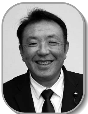
副議長 三浦雄一郎